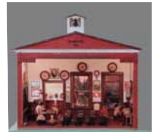
エルムウッド・スクールハウス 1900 年代初期（アメリカ）