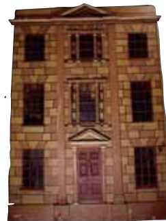
ジョージ三世王朝時代の家 1800 年（イギリス）