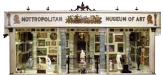
モトロポリタン美術館 1900 年代初期（アメリカ）