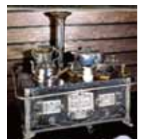
キッチン・ストーブ 1910 年頃（ドイツ）