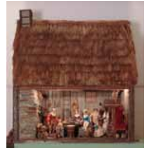
ピルグリム（清教徒）の住居 1900 年代初期（アメリカ）